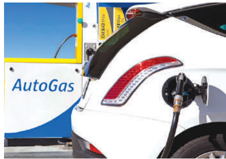
цит сжиженного газа, который составляет порядка 20–25%, констатируют в ведомстве.

Часть объемов сжиженного газа, распределяемого Минэнерго, направляется промышленным предприятиям, выпускающим нефтехимическую продукцию для развития нефтехимической отрасли. В итоге с учетом всех приведенных фактов в стране наблюдается неизбежный дефи-