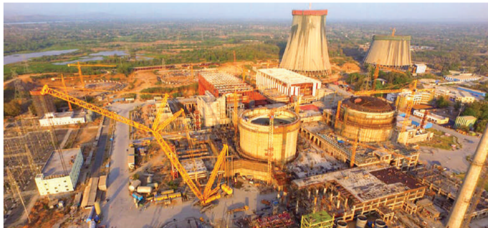
Окончание. Начало на стр. 1