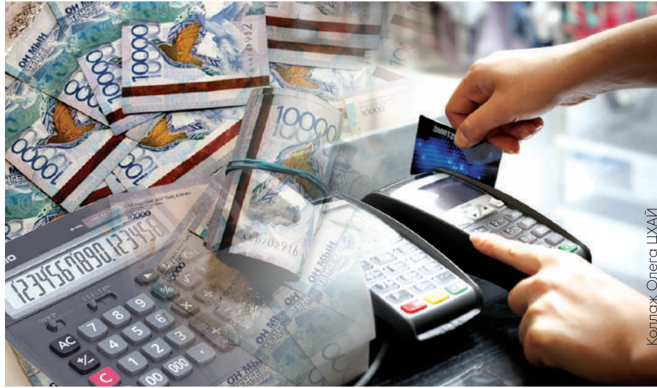
Коллаж: Ольга Цхай

Сегодня можно смело утверждать, что финансовый сектор Казахстана находится в авангарде цифровизации казахстанской экономики. Достигнуты значимые успехи в обеспечении роста безналичной экономики, развитии циф-