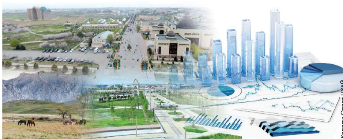
Коллаж Олгера ЦХАИ

В акимате полагают, что бюджетные инвестиции в инфраструктуру индустриальных зон позволят привлечь в 10 раз больше уже частных инвестиций. В ближайших планах – создать в регионе порядка 40 производственных объектов в этих парках. По первому этапу завершено строительство 10 зданий, в каждом из которых осуществляется по одному конкретному инвестпроекту. По второму этапу идет строительство еще 12 производственных объектов – сформирован пул инвестпро-