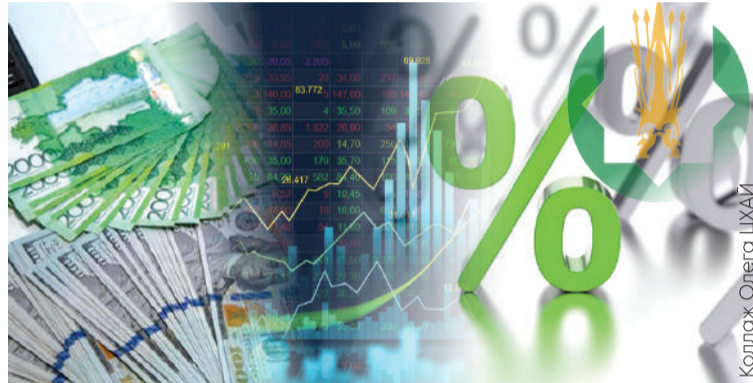
Коллаж: Олега ЦХАИ

– Основной фактор переукрепления в первом полугодии – фискальный, были недоплатившие по налогам, по корпоративному и НДС. Приходилось больше брать трансфертов и продавать больше трансфертов из Нацфонда, на текущий момент почти 80% трансфертов было реализовано. Фундаментальных факторов не было. Мы