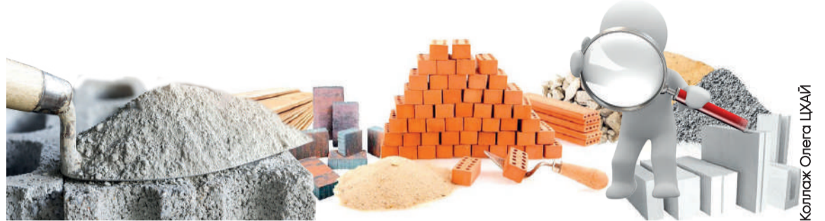
Коллаж Олега ЦХАЙ

Согласно законодательству Казахстана, такие товары как портландцемент, цемент глиноземистый и другие виды цемента, обязаны продаваться через товарные биржи при минимальной партии 60 тонн. В то время как казахстанские производители цемента вынуждены нести дополнительные затраты на биржевые комиссии, брокерские услуги и финансовое обеспечение