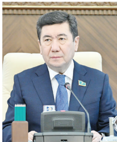
Ерлан КОШАНОВ, Председатель Мажилиса Парламента РК

Прошла историческая сессия Ассамблеи народа Казахстана. На ней Глава государства подвел основные итоги 30-летнего пути ассамблеи и отметил ее стратегическую роль в успешном развитии нашей страны.