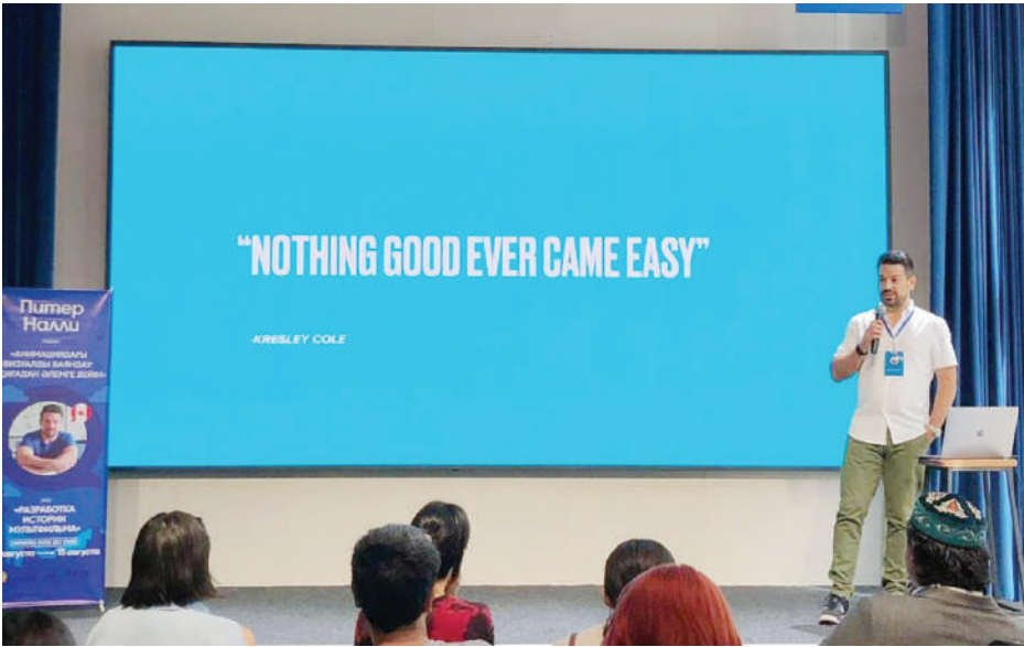
Полосу подготовил Айбек ҚАСЫМБЕК , Астана

Проект «От идеи до мультфильма» – это важный шаг к формированию сильного и конкурентоспособного анимационного сектора в Казахстане. Для многих участников он может стать отправной точкой в карьере и трамплином к новым творческим вершинам.