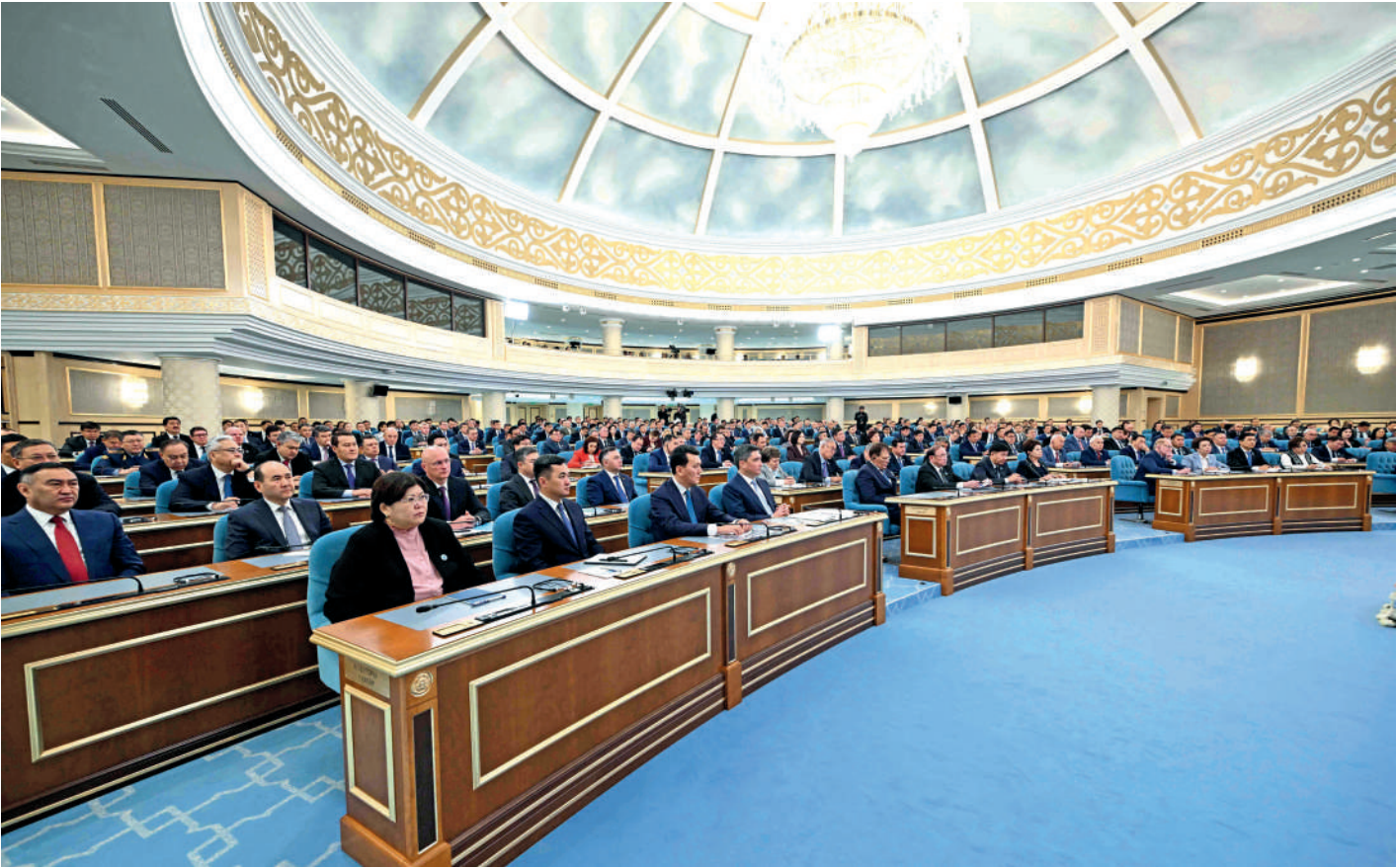
Окончание. Начало на стр. 1-3

В свое время наши «социальщики» придумали новую категорию, подлежащую льготным выплатам – неполные семьи. В результате резко выросо количество разводов, по этому показателю мы даже в свое время вошли в группу мировых «антиаидеров». Таких примеров немало, мы сами поощряем лень и иждивенчество.