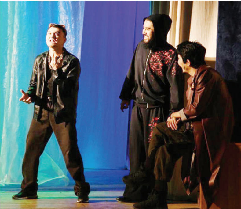
Полосу подготовила Миргуль ДЖИЛКИШИНОВА , Астана

– «S.O.S.» – это не просто театральная постановка, а большая работа, направленная на борьбу с наркоманией. Спектакль уже посмотрели более 220 школьников. Большинство из них – старшеклассники, – говорят организаторы.