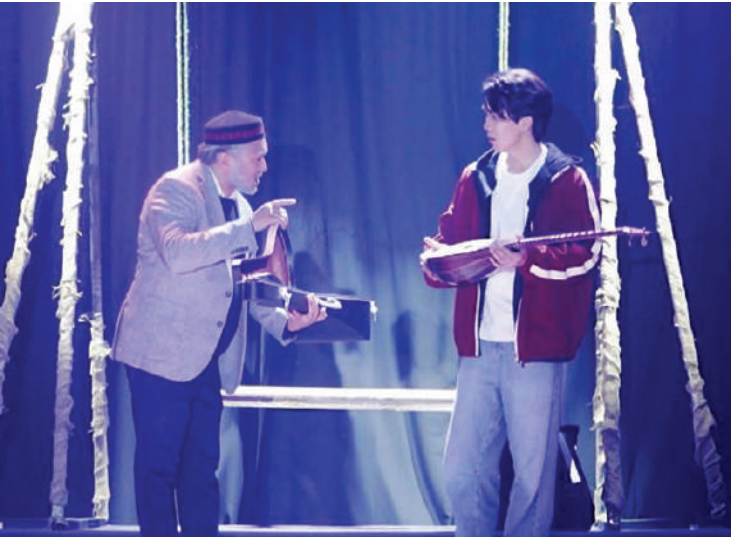
Полосу подготовила Миргуль ДЖИЛКИШИНОВА, Астана