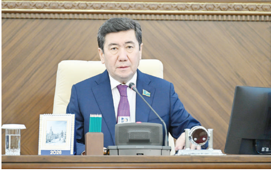
Ерлан КОШАНОВ, Председатель Мажилиса Парламента РК