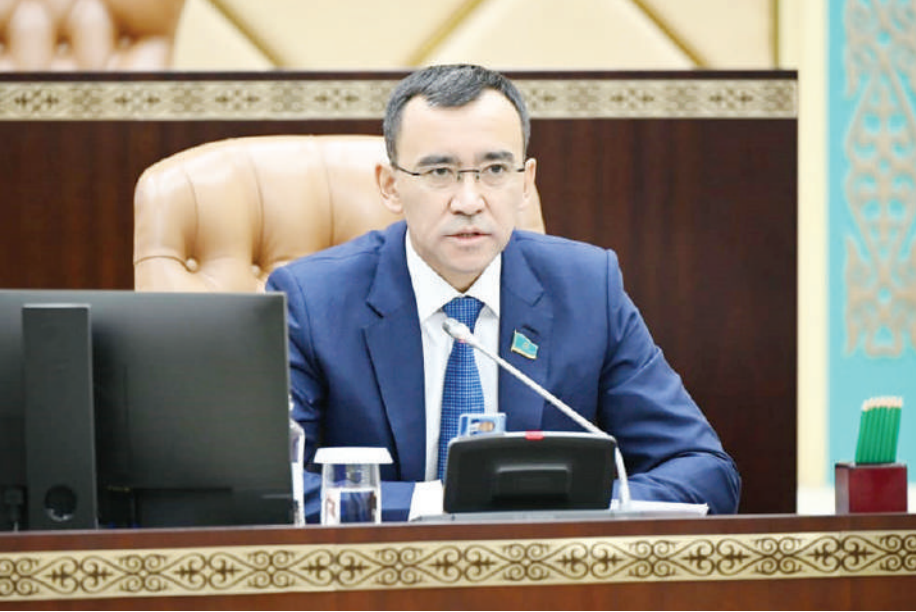
Маулен АШИМБАЕВ, Председатель Сената Парламента РК