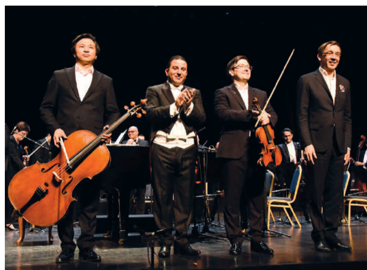
Полосу подготовила Мира АЗИЗОВА, Астана

Особым моментом вечера стал неожиданный бис – FORTE TRIO исполнило алжирскую мелодию в стиле гаи, вызвав бурную реакцию зала и продолжительные аплодисменты.