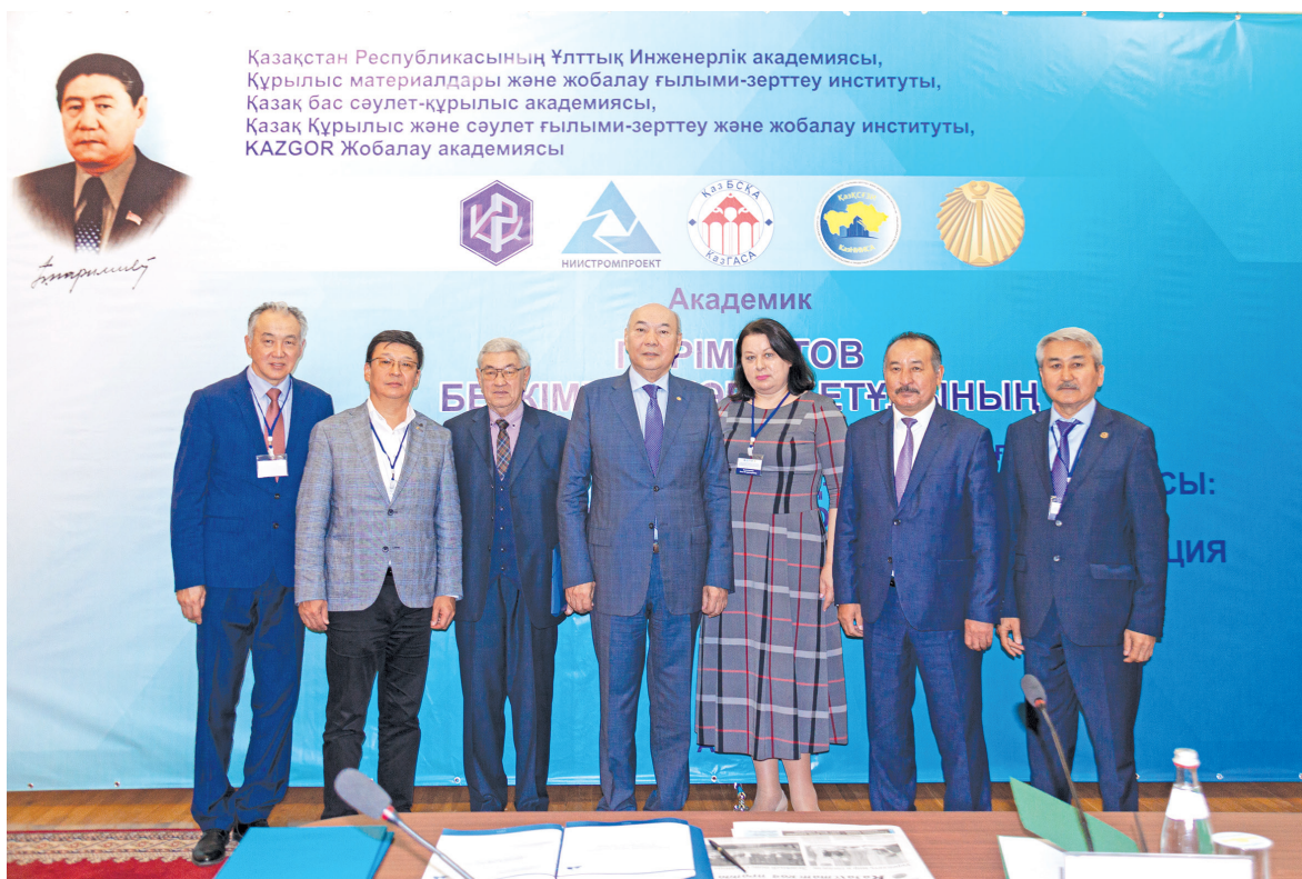
Казахстан Республикасының Ұлттық Инженерлік академиясы, Құрылыс материалдары және жобалау ғылыми-зерттеу институты, Қазақ бас сәулет-құрылыс академиясы, Қазақ Құрылыс және сәулет ғылыми-зерттеу және жобалау институты, KAZGOR Жобалау академиясы

Свои детские годы будущий министр провел в поселке Шиели Кызылординской области. После успешного окончания средней школы он в 1946 году поступил в Чимкентский технологический институт строительных материалов Министерства высшего образования СССР. С 1951 по 1954 годы являлся аспирантом Института строительства и строительных материалов Академии наук Казахской ССР, после чего с успехом защитил диссертацию на соискание степе-